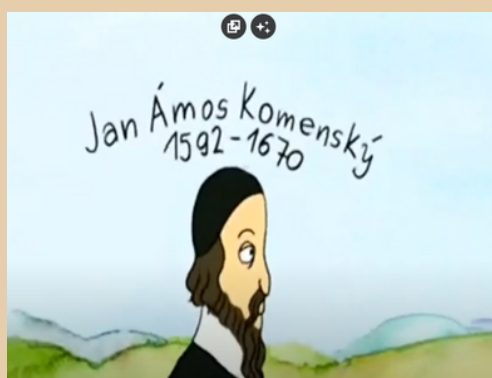
film Telewizji Czeskiej (2013)